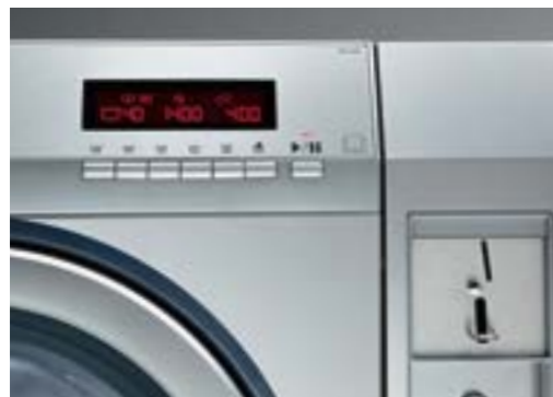
Laveuse myPROzip avec un monnayeur individuel