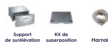
Support de surélévation