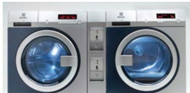
Laveuse et séchoir myPROzip avec double monnayeur